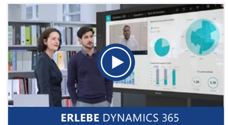
ERLEBE DYNAMICS 365

Hso ist das größte unabhängige Beratungs- und Implementierungsunternehmen für Microsoft Dynamics 365 mit Niederlassungen auf drei Kontinenten . Wir setzen sowohl unsere langjährige Beratungsexpertise als auch die modernste „ Digital Transformation Technology “ ein, um die Geschäftsabläufe und Geschäftsmodelle unserer Kunden zukunftsicher zu gestalten . Werde Teil der digitalen Transformation als: